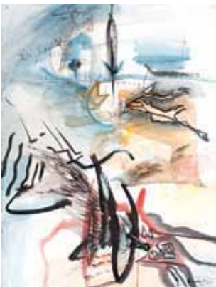
NON-NON III - Werwo? Mischtechnik 76,0 x 57,0 cm 1998