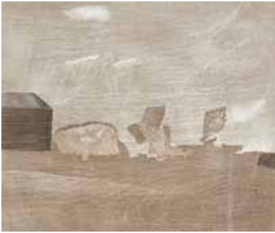
Novemberwind Farbholzriss 33,0 x 39,0 cm 1979