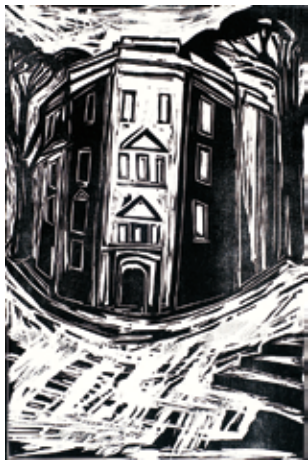
Altes Haus Holzschnitt 45 x 30 cm 2010