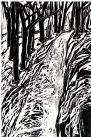
Zur schönen Aussicht Holzschnitt 45 x 30 cm 2010

Olga Nikishyna und Andrey Bassalyga sandten uns zum Jahreswechsel 2011 einen Gruß und eine Lithografie von Olga Nikishyna. Die Beiden hatten im Sommer 2005 im Grafik Museum mit weiteren Künstlern aus Minsk, Belarus, ausgestellt.