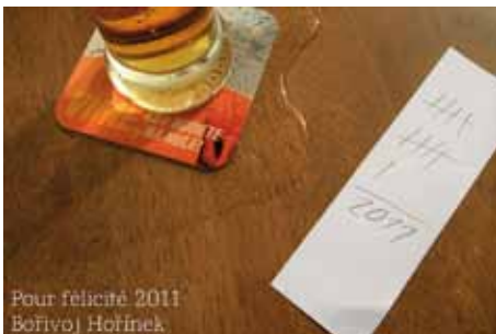
p.f. 2011 Fotografie 21,0 x 29,7 cm 2010

Von Bořivoj Hořinek aus Ostrov/Tschechien erhielten wir einen Neujahrsgruß als digitale Datei, deren Ausdruck auf einem Tintenstrahldrucker auf Spezialpapier wir in die Sammlung übernehmen.