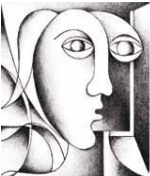
Ich Lithografie 22,0 x 19,0 cm 1933/2007

Conradine Gebhard, die Witwe des Künstlers Ludwig Gebhard aus Landsberg am Lech, schenkte dem Museum zwanzig Grafiken figuraler Art und Portraits aus dem Nachlass ihres Mannes. In Tiefenbach/Opf wurde ein Museum für die Arbeiten Ludwig Gebhards eingerichtet. In Landsberg zeigt die Galerie Gebhard Malerei, Grafik, Skulptur und mehr aus dem umfangreichen Schaffen Gebhards. Werke von ihm finden sich auch im Kunsthaus Rehau, das Gebhard im Herbst 2010 eine Ausstellung ausrichtete.