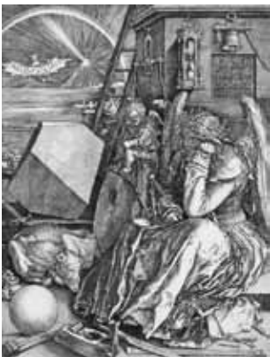
Die Melancholie Kupferstich 1514