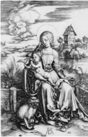
Maria mit der Meerkatze Kupferstich um 1498