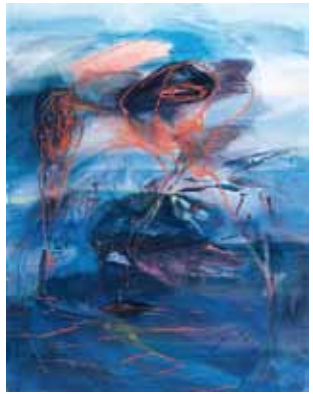
Das Einhorn Mischtechnik 76,0 x 57,0 cm 1993