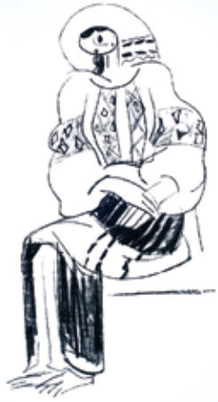
o. T. (Sitzende) Serigrafie 53,0 x 29,0 cm 2009