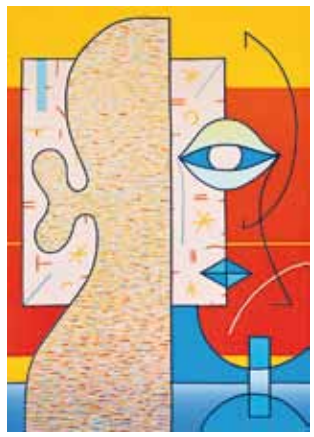
o. T. Farblinolschnitt 42,0 x 30,0 cm 1933/2007

Conradine Gebhard, die Witwe des Künstlers Ludwig Gebhard aus Landsberg am Lech, schenkte dem Museum zwanzig Grafiken figuraler Art und Portraits aus dem Nachlass ihres Mannes. In Tiefenbach/Opf wurde ein Museum für die Arbeiten Ludwig Gebhards eingerichtet. In Landsberg zeigt die Galerie Gebhard Malerei, Grafik, Skulptur und mehr aus dem umfangreichen Schaffen Gebhards. Werke von ihm finden sich auch im Kunsthaus Rehau, das Gebhard im Herbst 2010 eine Ausstellung ausrichtete.