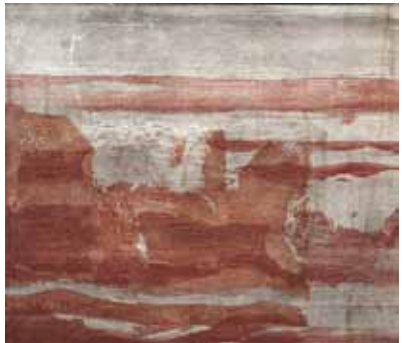
Krähenflug Farbholzriss 49,5 x 56,5 cm 2007