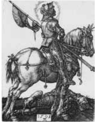
Der heilige Georg zu Pferd Kupferstich 1508