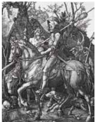
Ritter, Tod und Teufel Kupferstich 1513