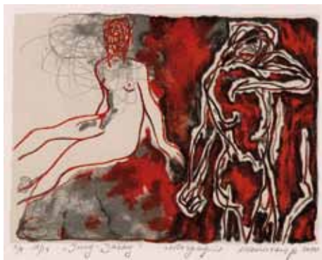
Olga Nikishyna East - West Lithografie 15 x 20 cm 2010

Olga Nikishyna und Andrey Bassalyga sandten uns zum Jahreswechsel 2011 einen Gruß und eine Lithografie von Olga Nikishyna. Die Beiden hatten im Sommer 2005 im Grafik Museum mit weiteren Künstlern aus Minsk, Belarus, ausgestellt.