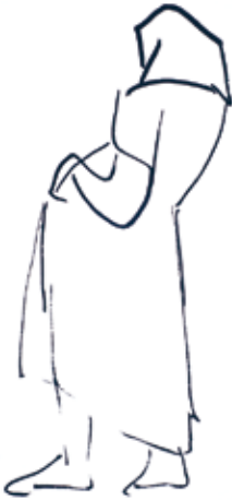
o. T. (Schwangere) Serigrafie 53,0 x 24,0 cm 2009