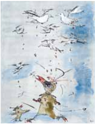
Luftiges Phänomen bei 972 bar aquarellierte Radierung 64,0 x 49,5 cm 2010