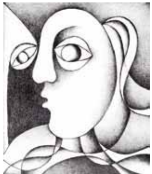
Du Lithografie 22,0 x 19,0 cm 1933/2007