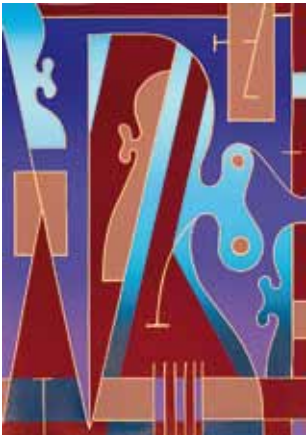
o. T. Farblinolschnitt 42,0 x 30,0 cm 1996